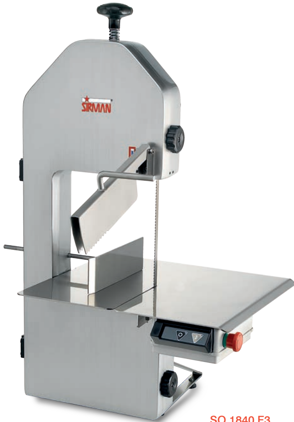
SO 1840 F3