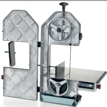
SO 1650 F3