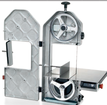
SO 1840 F3