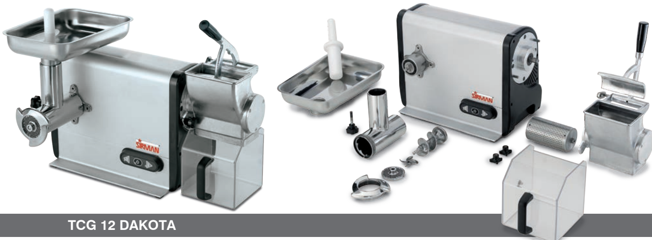
TCG 12 DAKOTA