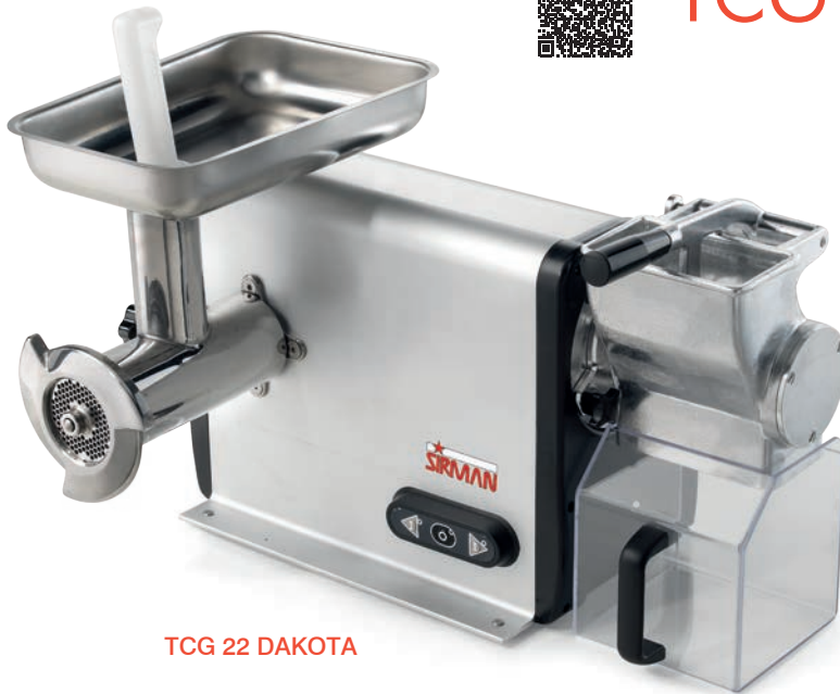
TCG 22 DAKOTA